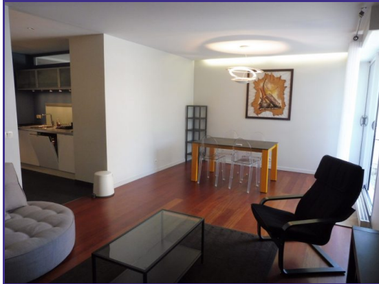
Extérieur - Vue Bastille